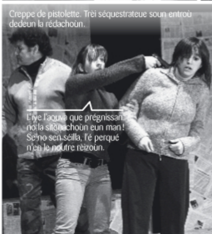
Creppe de pistolette. Trèi séquestrateue soun entroù dedeun la rédachouin.

E'ye l'aque que prégnissan no la sit'achouin eun man ! Se'no sèn sèilla, l'é perqué n'è le noutrè rèzoun.