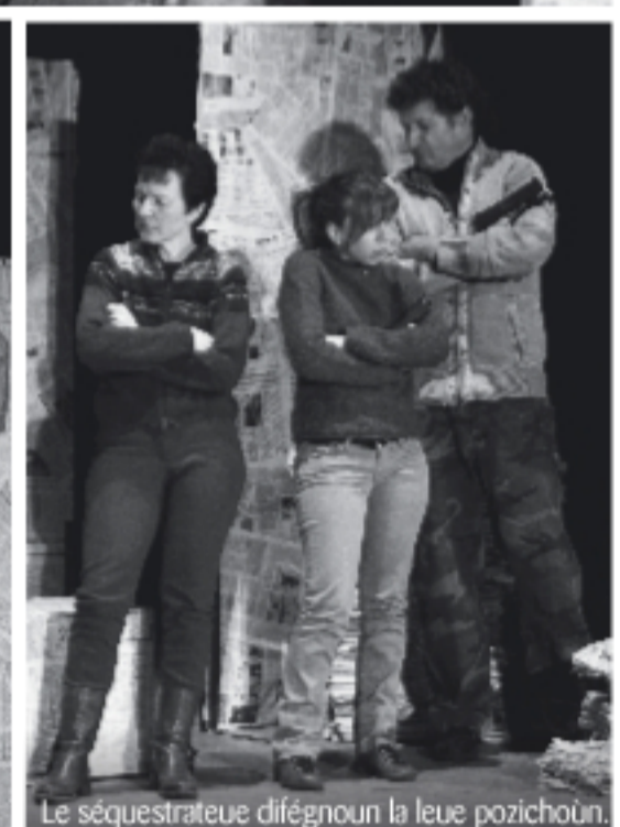
Le séquestrateue difègnoun la leue pozichouin.

La fèi vouèi pa coumprèi que seutta l'é pa la magniye é gneunca la plase pe rezoudre le voutre problème !