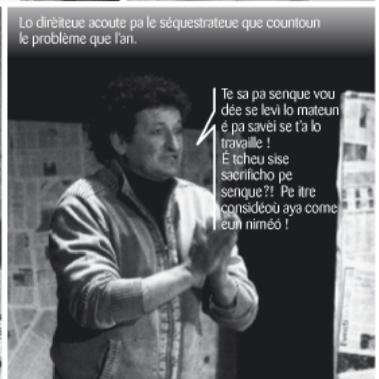
Lo dirèiteue acoute pa le séquestrateue que countoun le problème que l'an.

No sèn stouffie d'itre préi pe de babotche ! Sèn que icriade desi lo journalle la mèitchà di ten l'é pa vrèi !