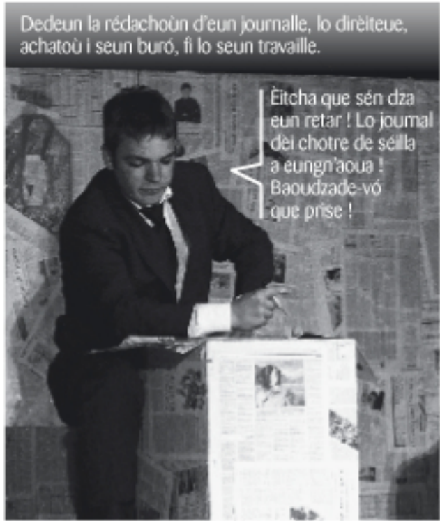
Dedeun la rédachouin d'eun journalle, lo dirèiteue, achatoù i seun buró, fi lo seun travaille.

Èitcha que sèn dza eun retar ! Lo journal dei chotre de sèilla a eungh'oua ! Baoudzade-vó que prise !