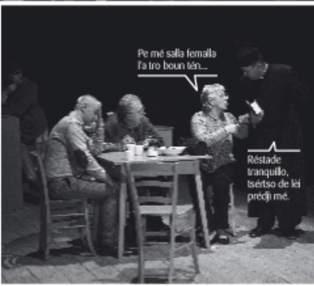
Pe mé salla femalla t'a tro beun tén...

Voueu mateun n'i criyâ lo priye, aya sariye fran lo moman djesta.