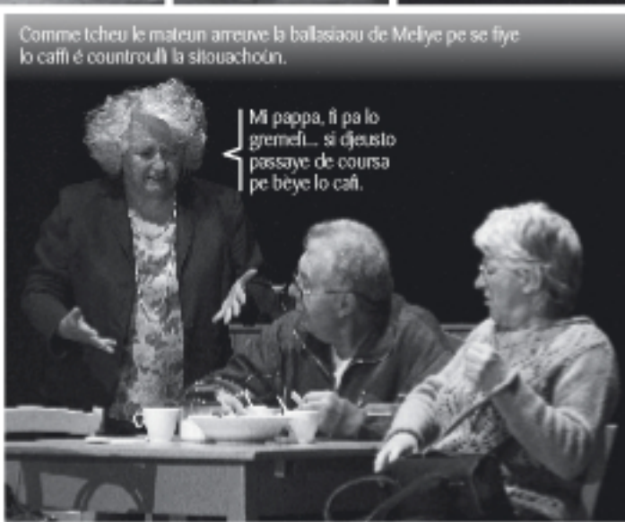
Comme tcheu le mateun arrive la ballasiou de Meliye pe se fiye lo café é countrouli la situachoun.

Eh... vou éi beun rézoûn totte dove, si fran eun trén de me léichi all'.