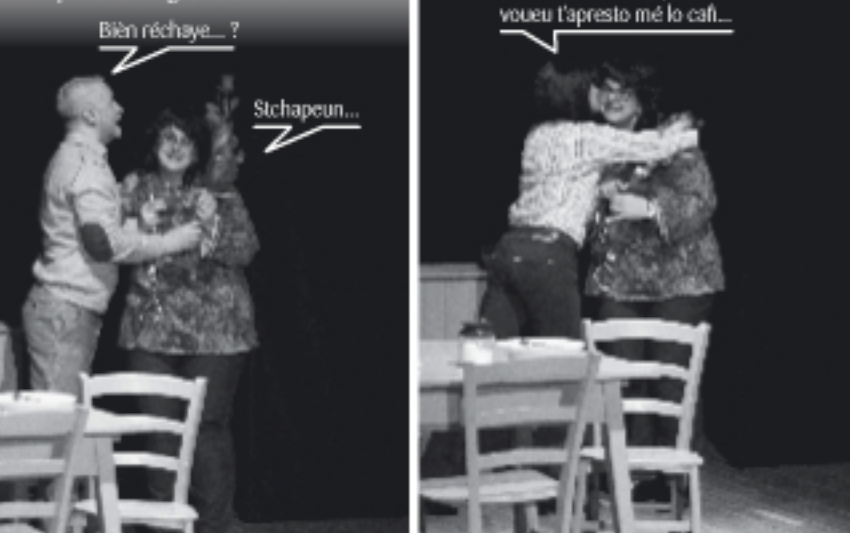
Gueuste léi prédze i bouigno é léi fi de-z-avance.