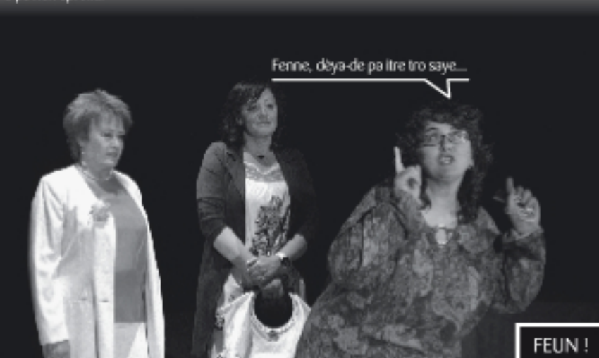
Tcheutte l'an coumprié que la fameulle l'é empouranta é tcheutte déyoun bailli eunna man é pa nen aprofiti.