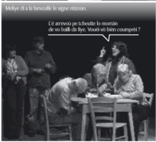
L'é arrevoué pe tcheutte lo moman de vo bailli da fiye. Vouéi-vo bien coumprié ?

Mi pappà, fi pa lo gremé... si djesta passaye de coursa pe biye lo café.