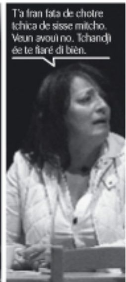
T'a fran lata de chotre tchica de sisse mitcho. Vouu avoué no. Tchardji ée te firé di bien.

Achattade vo-zé eun pégnio moman, senque poui-dzô vo bailli ? Eun tsiquet, eun boun café ?