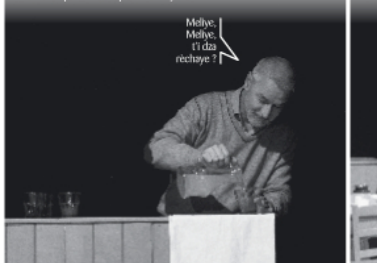
Lo mateun aprî Gueuste apreste lo didjeun.