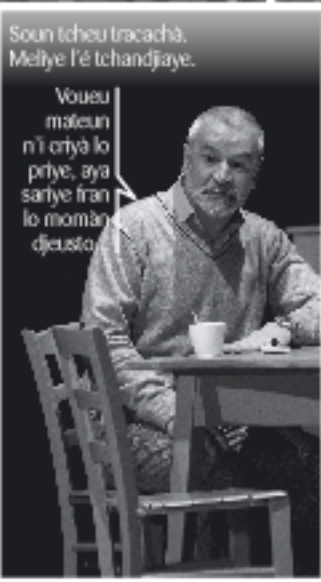
Soun tcheu tracachà, Meliye l'é tchandjaye.

Voueu mateun n'i criyâ lo priye, aya sariye fran lo moman djesta.