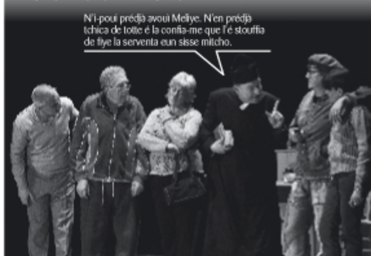
Lo Priye, aprî avèi prédjâ avouî Meliye, reprodze totta la fameulle.

N'i-pouî prédjâ avouî Meliye. N'en prédjâ tchica de totte é la confia-me que l'é stouffia de fiye la serventa eun sisse milcho.