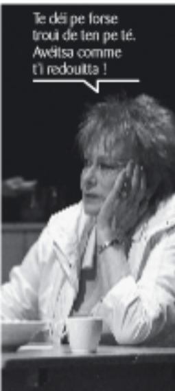
Te déi pe forse troui de ten pe té. Awétisa comme t'i redoultta !