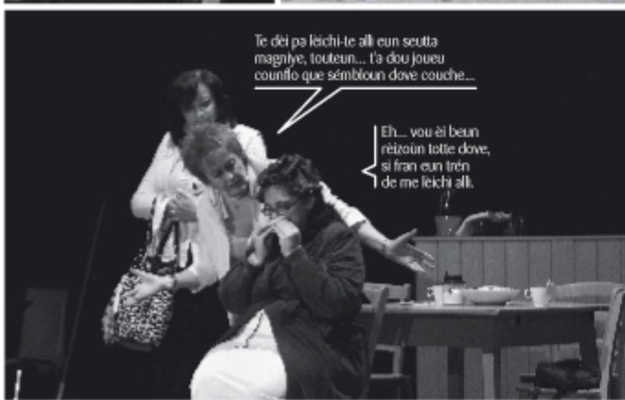
Te déi pa léichi-te all' eun seutta magniye, touteun... t'a dou joueu counfilo que sémbloin dove couche...

Eh... vou éi beun rézoûn totte dove, si fran eun trén de me léichi all'.