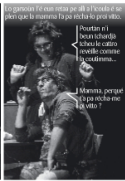
Lo garsoin l'é eun retsa pe all' a l'icoula é se pien que la mamma l'a pa récha-lo proi vitto.