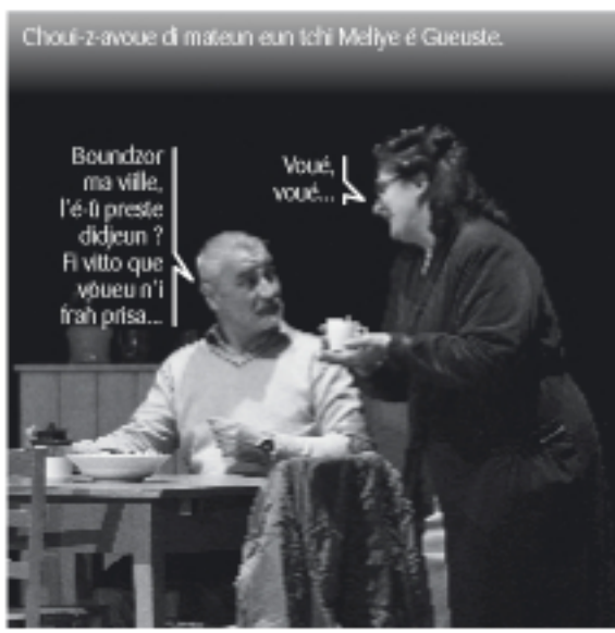
Chou-z-aveu di mateun eun tchi Meliye é Gueuste.